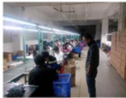
Finished product assembly